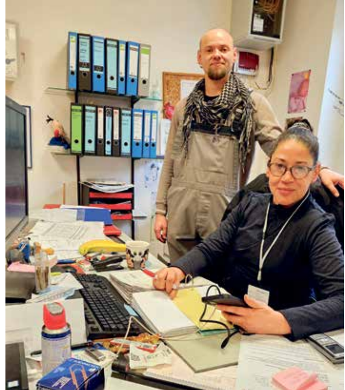
Facebookgruppe „Bilder aus Mannheim“